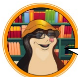
БИБЛИОТЕКАРЬ СУМЧАТЫЙ КРОТ

СПРАВКА. Элегия – стихотворение, в котором автор размышляет о трудностях жизни. Притча – небольшой рассказ нравоучительного характера, родственник басне. Ода – торжественное стихотворение, посвящённое какому-то событию или человеку. Комедия – произведение с юмористическим содержанием. Былина – русская народная эпическая песня о богатырях.